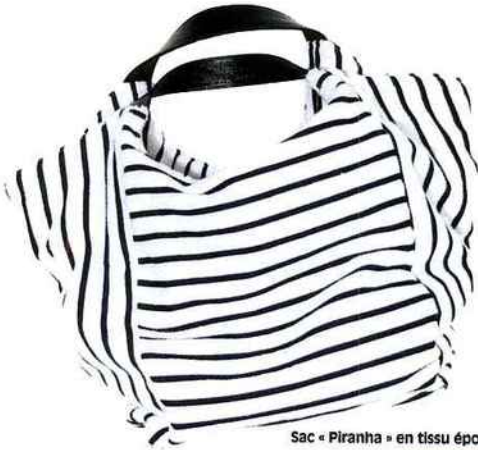
Sac « Piranha » en tissu éponge et anses en vinyle (89 €, Zoeppritz).