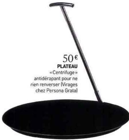
50 € PLATEAU « Centrifuge » antidérapant pour ne rien renverser (Virages chez Persona Grata)