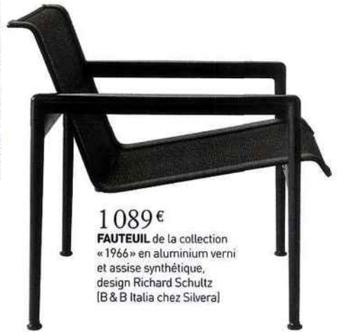
1 089 € FAUTEUIL de la collection « 1966 » en aluminium verni et assise synthétique, design Richard Schultz [B & B Italia chez Silvera]

Prenez le parti de l'élégance avec des lignes et teintes sobres