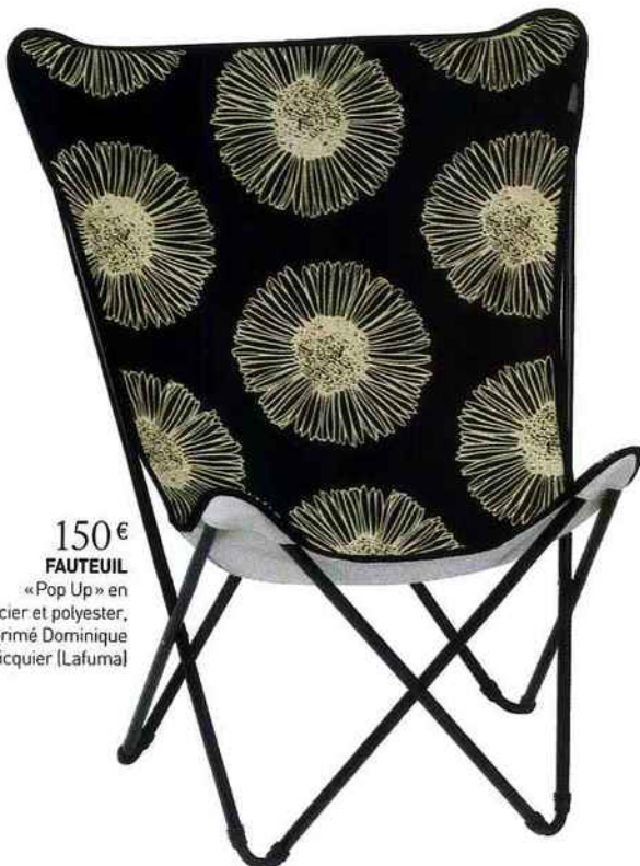
150 € FAUTEUIL « Pop Up » en acier et polyester, imprimé Dominique Picquier [Lafuma]