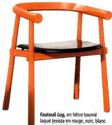
Fauteuil Log , en hêtre tourné laqué (existe en rouge, noir, blanc et ton naturel), assise en cuir, design Patricia Urquiola, L 60 x P 50 x H 69 cm, à partir de 2 173 €, Forum Diffusion.