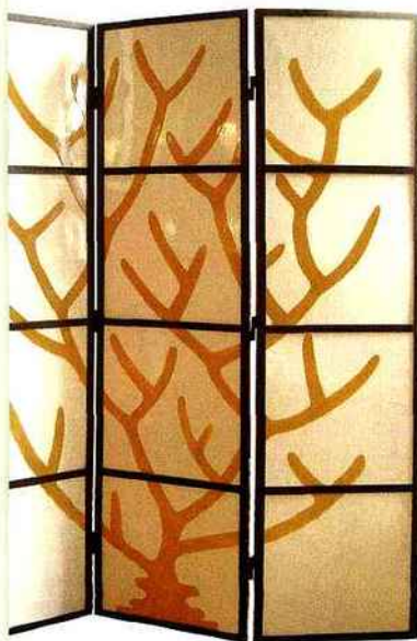
Paravent Corail , en fer patiné et carreaux de céramique, composé de trois panneaux de L 40 x H 160 cm, 1 790 €, Virebent.