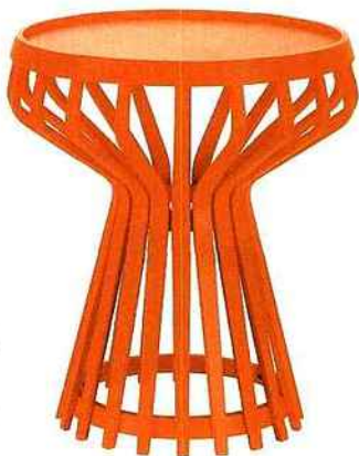
Table Deena , en contreplaqué et hêtre laqué, D 47 x H 52,5 cm, 200 €, Habitat.