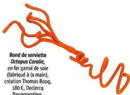
Rond de serviette Octopus Coralie , en fer gansé de soie (fabriqué à la main), création Thomas Boog, 180 €, Declercq Passementiers.

Miroir, paravent, chaise, assiette, soliflore... la déco a le look corail !