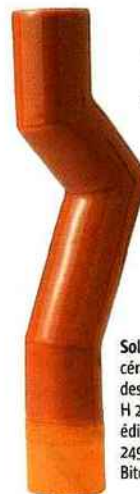
Soliflore Tube , en céramique, design Arik Levy, H 28 x D 4,5 cm, édition limitée à 249 exemplaires, Bitossi Ceramiche.