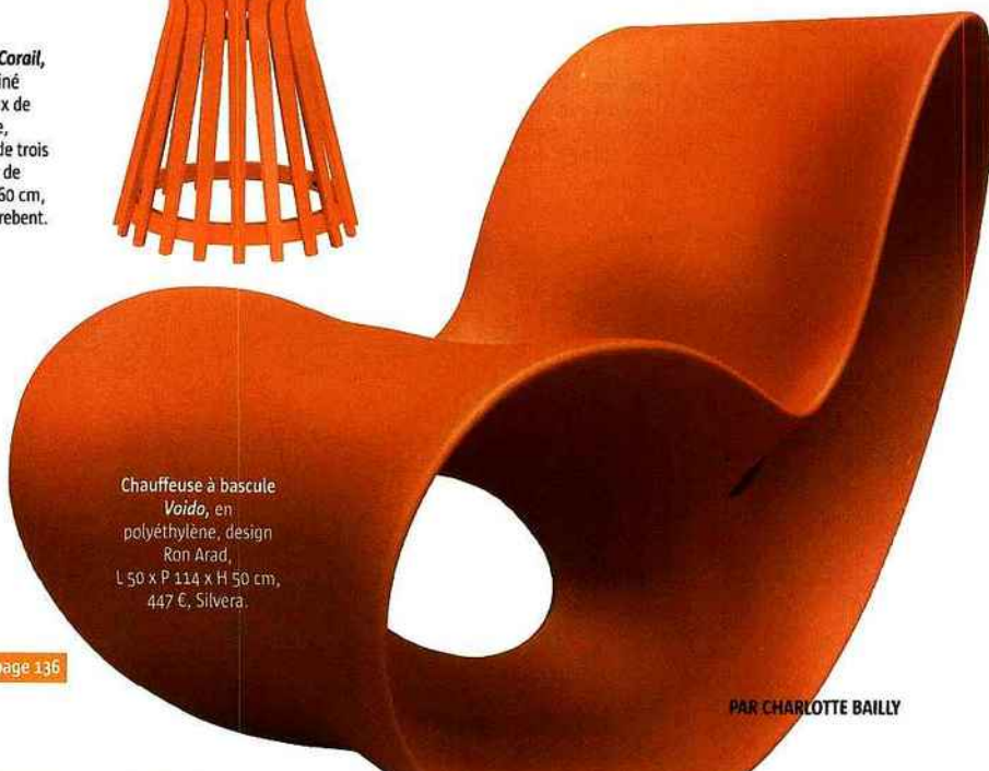
Chauffeuse à bascule Voido , en polyéthylène, design Ron Arad, L 50 x P 114 x H 50 cm, 447 €, Silvera.