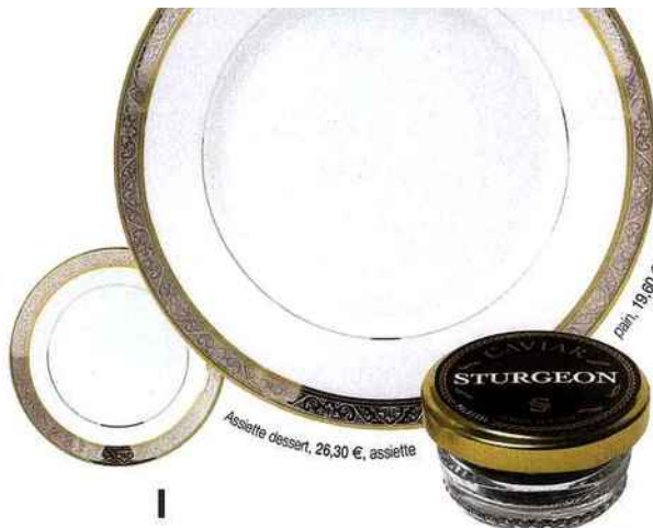
Assiette dessert, 26,30 €, assiette