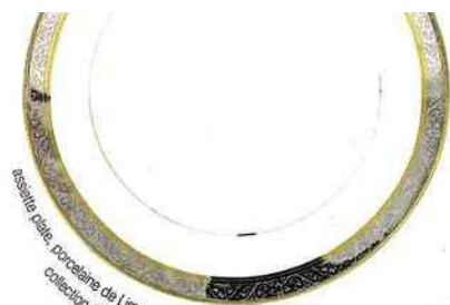
assiette plate, porcelaine de Limoges, collection Créans, Deshoulière, 27,70 €.