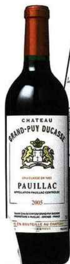
Bouteille Grand Puy Ducasse 2005, 37,50 €.