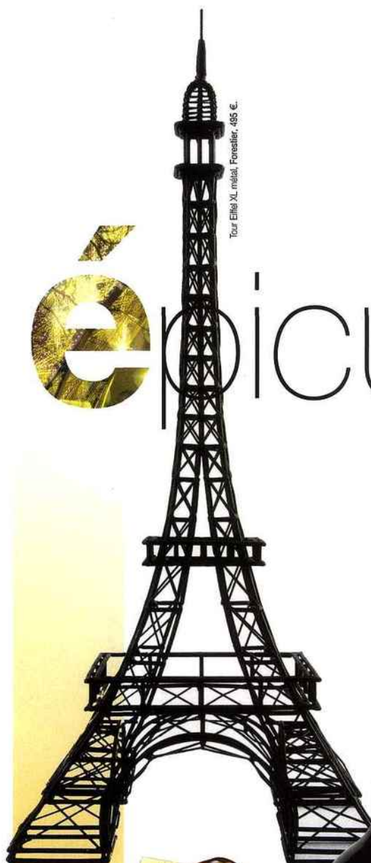
Tour Eiffel XI, métal, Forestier, 495 €.