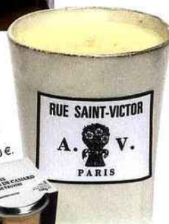
Bougie parfumée, godet céramique, 360 g, Astier de Villatte, 110 €.