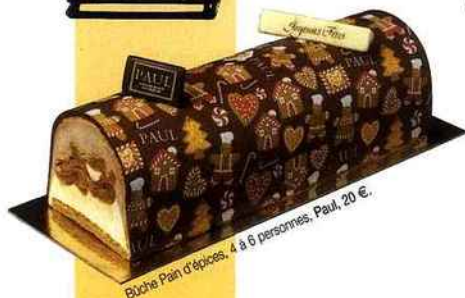
Bûche Pain d'épices, 4 à 6 personnes, Paul, 20 €.