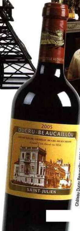
Château Ducru Beaucailou 2005 Grand Cru Classé, en vente sur www.wineandco.com , 167 €.

La tradition est de mise dans cette maison où Valérie Vimat continue l'œuvre de son père Le Chef, Alain Solivères, propose une grande cuisine du moment, sous influence méditerranéenne, qui frôle la perfection. La qualité de l'accueil, du service et une cave exceptionnelle en font un lieu incontournable. Taillevent.