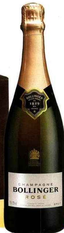
Champagne Bollinger Rosé, 70 €.