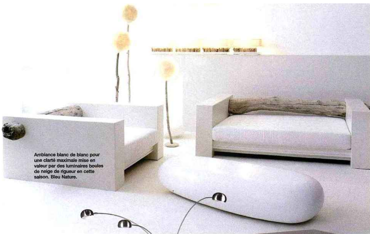
Ambiance blanc de blanc pour une clarté maximale mise en valeur par des luminaires boules de neige de rigueur en cette saison. Bleu Nature.

envies. Lustres, suspensions, lampes à poser, guirlandes, lampadaires, cubes... les formes de lumière artificielle sont multiples et variées. Ce sont ces éclairages, choisis et disposés avec attention, qui déterminent l'ambiance générale de votre intérieur. Modernité oblige, les modèles design aux lignes épurées sont de mise. Il est donc primordial de ne pas se tromper dans vos choix.