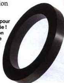
► Une lampe à poils pour une originalité assurée ! Ses 102 LEDS et son pourtour en fibre polyamide en font un objet de décoration à part entière. Cinna, Poils, création Marc Sarrazin, 1.070 € environ.

permettent d'éclairer toute une pièce mais aussi de travailler sur les changements de couleur. Consommant six fois moins de Watts qu'un éclairage classique, pour une durée de vie vingt-cinq fois supérieure, elles sont d'intensités différentes pour créer l'ambiance désirée.