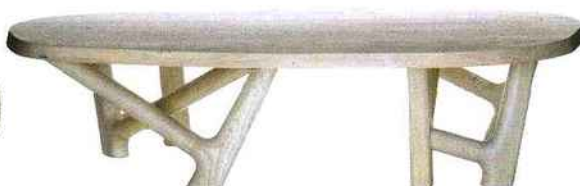
Branchée Table basse "Oba" en chêne, 170 x 90 x 40 cm, design Jean-Pierre Tortil, 5 817 € (éd. Christophe Delcourt).