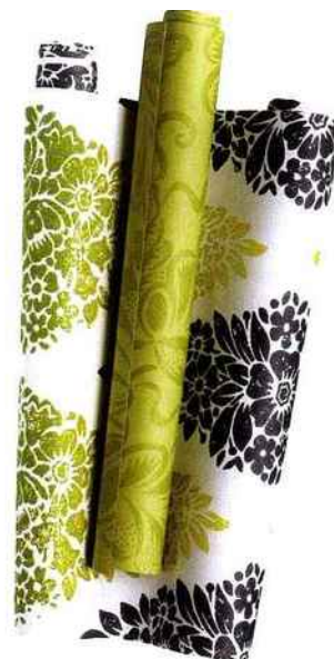
En bouquet Papiers peints "Irise" et "Zakharov", 66,70 € le rouleau de 10 x 0,52 m (Designers Guild).