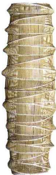
Dans la nasse Lampe "Tour de Babel" en bambou, h. 136 cm, 269 € (L'Entrepôt).