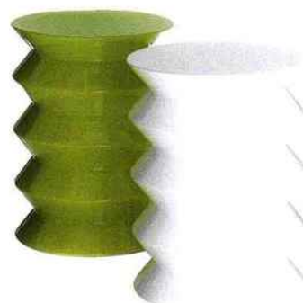
Accordéon Tabourets "14 Juillet" en faïence, 380 € l'un (Manufacture Virebent).