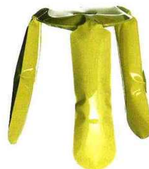
Métal récup' Tabouret "Plop", 365 € (Fleux).