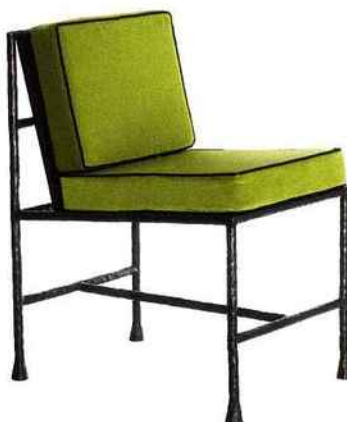
Fer forgé Fauteuil "Damier", design Vincent Colin, h. 79 x l. 45 cm, 950 € + 1 m de tissu (Edition Limitée).