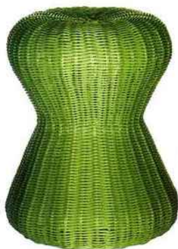
Tressé Tabouret "Scoubidou" en PVC, h. 43 x diam. 32 cm, 25 € (Alinéa).