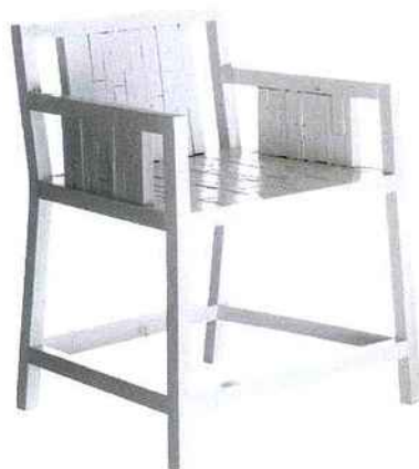
Carré laqué Fauteuil en bois flotté peint, 235 € (Pacific Compagnie).