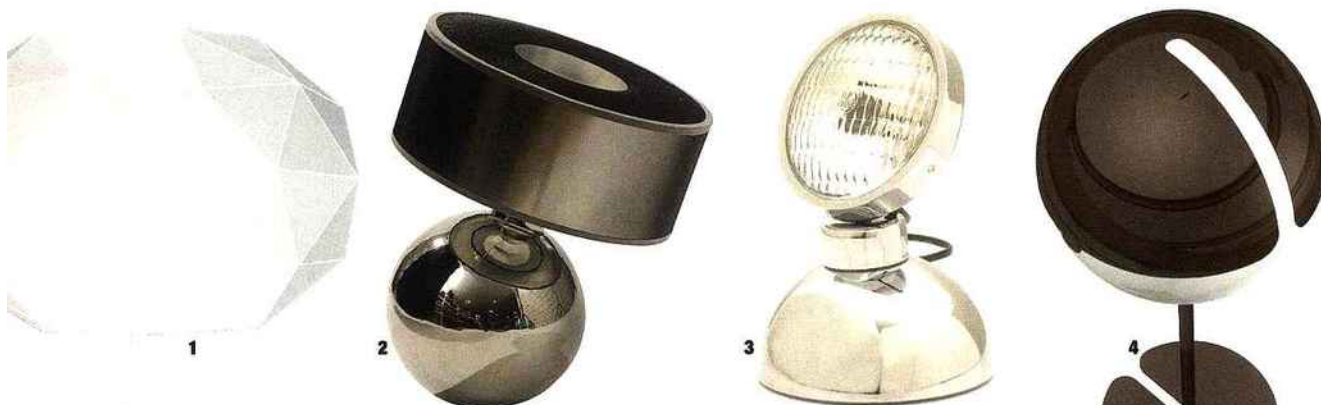
(1) « Soffione » prouve que le savoir-faire des maîtres verriers et le design ne sont pas antinomiques. Ce lampadaire au pied en aluminium moulé se coiffe d'un diffuseur en verre soufflé aux multiples facettes (1000 €, Artemide). (2) « Bomba », la lampe en céramique émaillée, est disponible en 50 coloris (à partir de 220 €, Roche Bobois). (3) Lampe « Vintage 1969 » d'Azimut Industries (180 €, Homology). (4) « Pearl », en Plexiglas, acier et aluminium, affiche une silhouette tout en rondeurs (195 €, Marzais Créations).