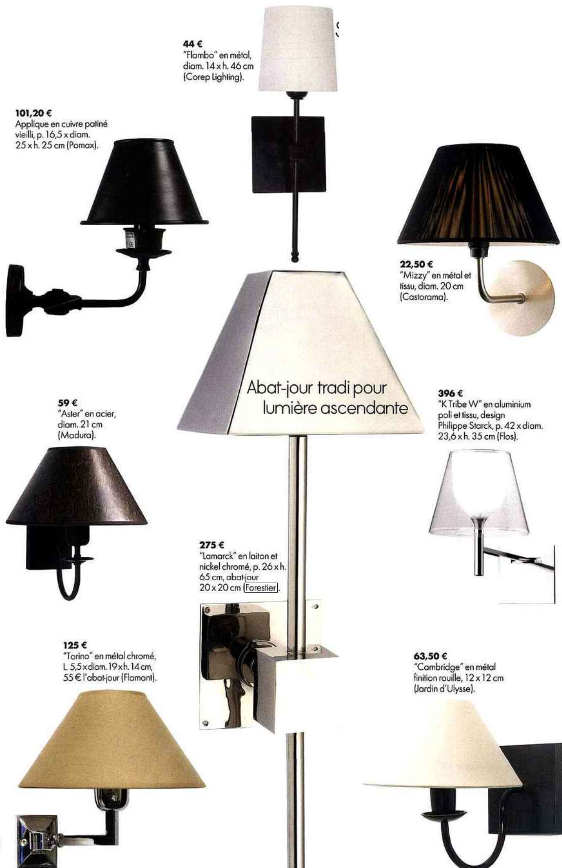
44 € "Flambo" en métal, diam. 14 x h. 46 cm (Corep Lighting).