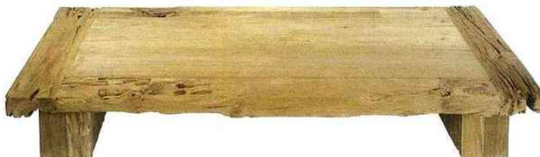
Table basse « Coffee Table » en bois exotique massif, design Sarah Lavoine, L. 2 x l. 1 m, prix sur demande, sarahlavoine.com