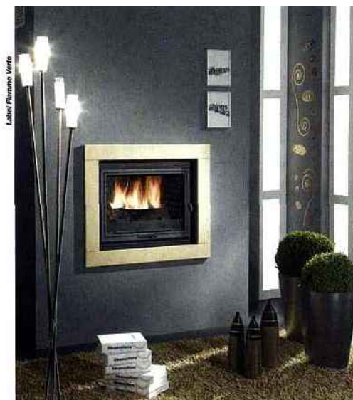
Label Flamme Verte

▲ Pour chaque appareil labellisé Flamme Verte, un dossier technique (contenant, entre autres, un rapport d'essais par un laboratoire européen notifié) est analysé puis validé par CERTITA, organisme de contrôle, notamment en charge de la marque NF.