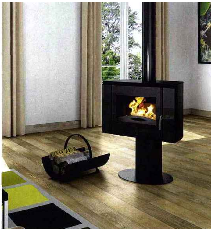
Deux par deux Le poêle à bois s'accompagne généralement d'un porte-bûches assorti. Supra.

Un brin d'élégance Ce porte-ustensiles bronze et métal contient les 4 accessoires indispensables à votre foyer et à l'entretien du feu. Jardin d'Ulysse, porte-ustensiles Modern, 115 € environ.