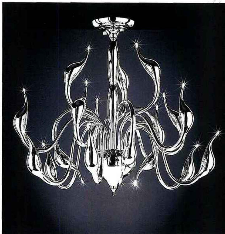
CYGNE Lustre en métal chromé. Existe en deux tailles. PM : 12 x 20 W. Dim Ø 70 x 70 cm, 1 100 €. GM : 18 x 20 W. Dim Ø 90 x 90 cm, 2 290 € (Epi Luminaires).