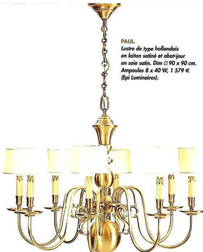
PAUL Lustre de type hollandais en laiton satiné et abat-jour en soie satin. Dim Ø 90 x 90 cm. Ampoules 8 x 40 W, 1 579 € (Epi Luminaires).