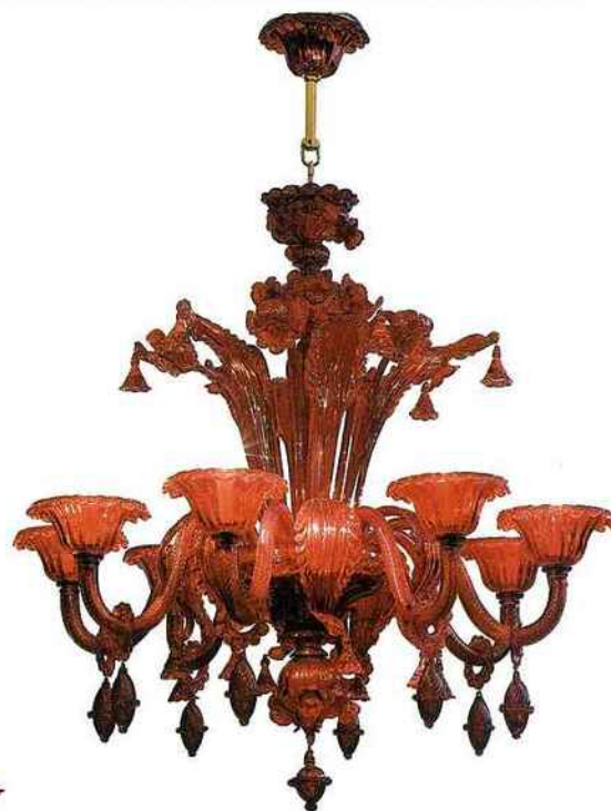
VERDI Magnifique lustre en verre de murano rouge avec huit lumières, 6 900 € (Roche Bobois).