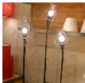
Angel des Montagnes - Lampe

Angel des Montagnes propose des meubles et objets aux matières authentiques telles que la laine, le coton, le lin, le bois, le métal brut et le verre soufflé. Lors du salon Maison & Objet, la rédaction de Marieclairemaison.com a été séduite par cette lampe dont la structure est en métal et l'abat-jour en verre soufflé. Pour un style entre tradition et modernité.