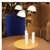
Molo – Lampe à poser Cappello

Au détour des allées du salon Maison&Objet, l'équipe de marieclairmaison.com a fait des découvertes lumineuses. Suspensions, lampe à poser, lampions... les luminaires jouent la carte de la fantaisie et de la différence.