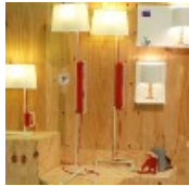
Pulpo - Lampadaire Stan