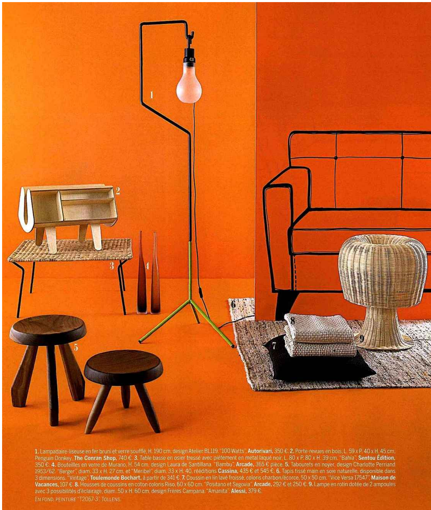
1. Lampadaire-liseuse en fer bruni et verre soufflé, H. 190 cm, design Atelier BL119, "100 Watts", Autorivari , 350 €. 2. Porte-revues en bois, L. 59 x P. 40 x H. 45 cm, Penguin Donkey, The Conran Shop , 740 €. 3. Table basse en osier tressé avec piètement en métal laqué noir, L. 80 x P. 80 x H. 39 cm, "Bahia", Sentou Édition , 350 €. 4. Boutelles en verre de Murano, H. 54 cm, design Laura de Santillana, "Bambu", Arcade , 365 € pièce. 5. Tabourets en noyer, design Charlotte Perriand 1953/62, "Berger", diam. 33 x H. 27 cm, et "Meribel", diam. 33 x H. 40, rééditions Cassina , 435 € et 545 €. 6. Tapis tissé main en soie naturelle, disponible dans 3 dimensions, "Vintage", Toulemonde Bochart , à partir de 341 €. 7. Coussin en lin lavé froissé, coloris charbon/écorce, 50 x 50 cm, "Vice Versa 17547", Maison de Vacances , 107 €. 8. Housses de coussins en coton coloris Riso, 60 x 60 cm, "Positano et Segovia", Arcade , 292 €, et 250 €. 9. Lampe en rotin dotée de 2 ampoules avec 3 possibilités d'éclairage, diam. 50 x H. 60 cm, design Frères Campana, "Amanita", Alessi , 379 €.