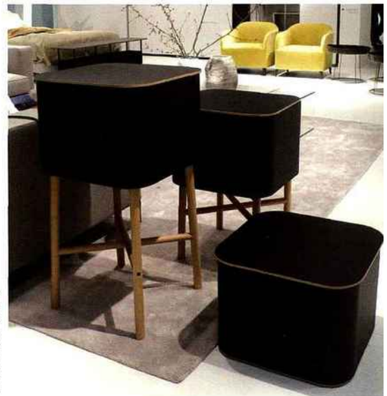
"Ô Perché", design Julie Pfligersdorffer . Boîtes de rangement en multiplis laqué noir sur un piétement en hêtre massif. Premier Prix du Concours Design Cinna 2011 dans la catégorie "Petits Meubles". Cinna