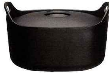
"Sarpaneva", design Timo Sarpaneva . Une cocotte en fonte, classique dessinée en 1960. Le manche en bouteau amovible est à la fois ergonomique et inspiré. iittala