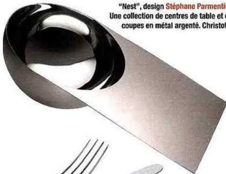
"Nest", design Stéphane Parmentier . Une collection de centres de table et de coupes en métal argenté. Christofle