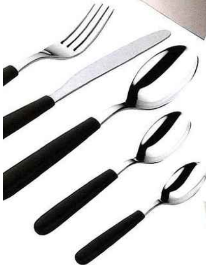
"All-Time", design Guido Venturini . Un service de couverts en acier inoxydable avec poignées en résine thermoplastique déclinées en six coloris. Alessi