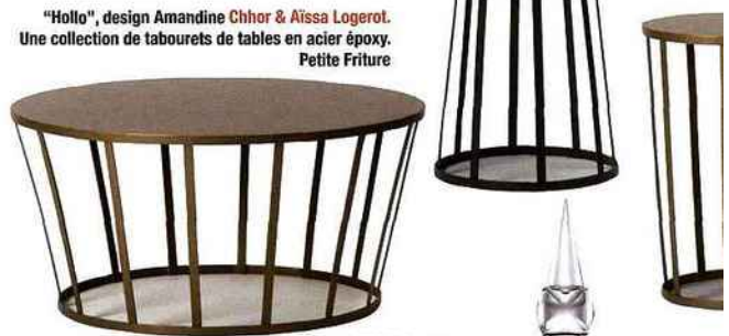
"Hollo", design Amandine Chhor & Aïssa Logerot . Une collection de tabourets de tables en acier époxy. Petite Friture