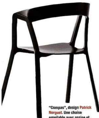
"Compas", design Patrick Norguet . Une chaise empilable avec assise et dossier en polypropylène sur un piétement en aluminium moulé sous pression et laqué époxy. Kristalia