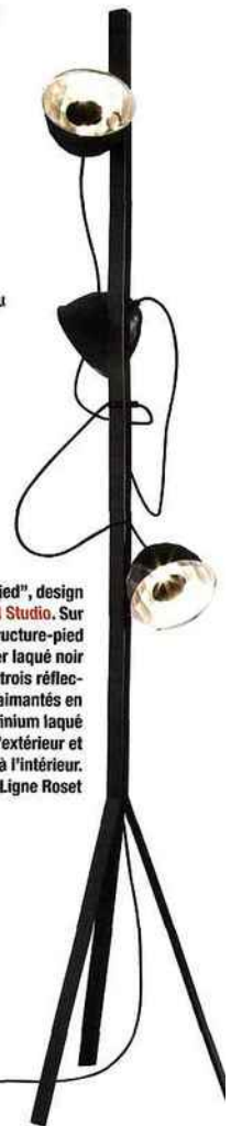
"Trépied", design Normal Studio . Sur une structure-pied en acier laqué noir satiné, trois réflecteurs aimantés en aluminium laqué noir à l'extérieur et verni à l'intérieur. Ligne Roset