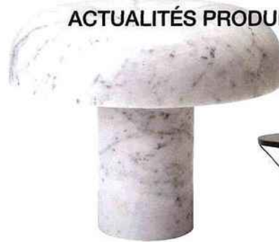
"Marie", design Toni Grito . Une lampe à poser déclinée en chêne naturel, chêne teinté noir, aluminium poli, marbre blanc de Carrara et liège noir. Haymann