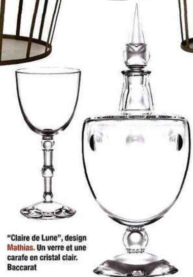
"Claire de Lune", design Mathias . Un verre et une carafe en cristal clair. Baccarat