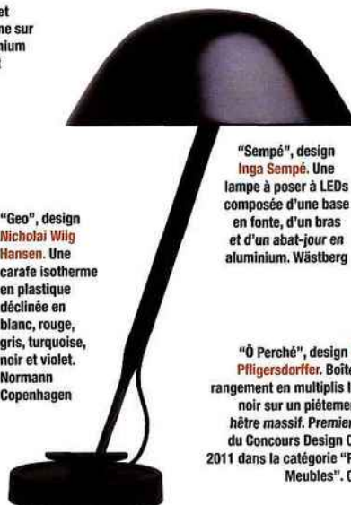
"Sempé", design Inga Sempé . Une lampe à poser à LEDs composée d'une base en fonte, d'un bras et d'un abat-jour en aluminium. Wästberg