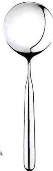
"IS01", design Inga Sempé . Une cuillère de service pour risotto en acier inoxydable. Alessi