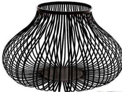
"Bidum", design Laetitia Florin . Un panier de rangement en lames d'acier ressort gainées d'un ruban de coton. Cinna