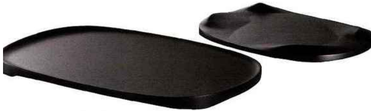
"Trayscape", design Urbanus . Une collection de plateaux "(Un)forbidden city", réalisée en collaboration avec le Centre de Design Industriel de Beijing. Réversible, le plateau propose un double usage. Alessi