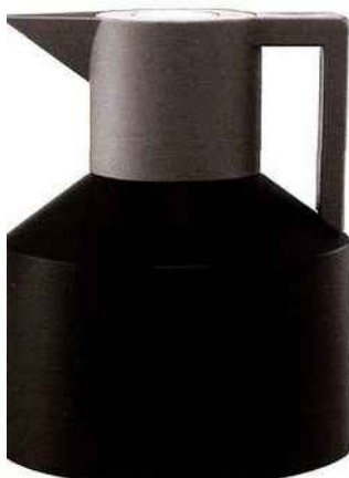
"Geo", design Nicholai Wiig Hansen . Une carafe isotherme en plastique déclinée en blanc, rouge, gris, turquoise, noir et violet. Normann Copenhagen