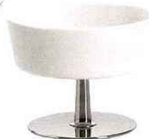
"Ape", design Giulio Iacchetti . Un plat de service pour l'apéritif en résine thermoplastique sur un présentoir en acier inoxydable. Alessi