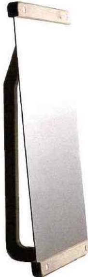
"Salvador", design Jennifer Rabatel . Un miroir à poser en bois de tilleul et inox poli. Édition Sous Étiquette