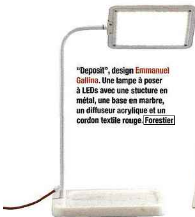
"Deposit", design Emmanuel Gallina . Une lampe à poser à LEDs avec une structure en métal, une base en marbre, un diffuseur acrylique et un cordon textile rouge. Forestier