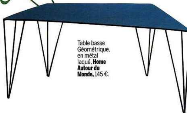
Table basse Géométrique, en métal laqué, Home Autour du Monde, 145 €.

Fauteuil Hee Lounge, en fils d'acier galvanisé, design Hee Welling, Hay, 228 €.