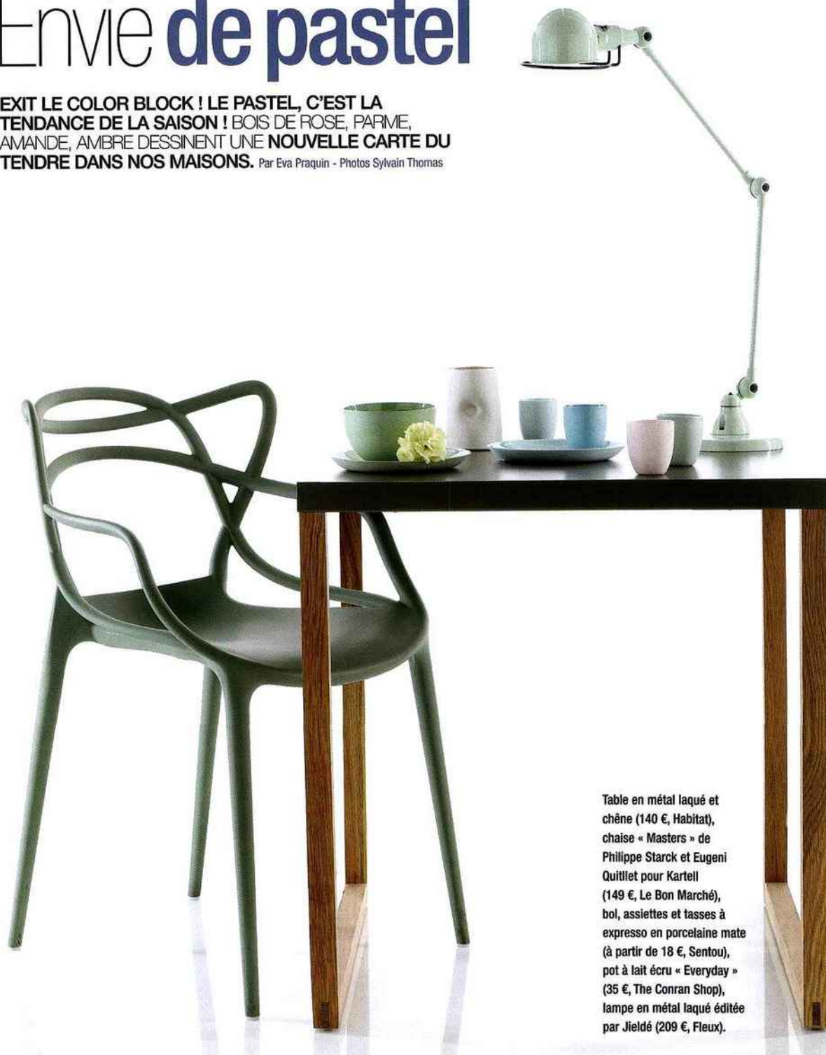
Table en métal laqué et chêne (140 €, Habitat), chaise « Masters » de Philippe Starck et Eugeni Quitllet pour Kartell (149 €, Le Bon Marché), bol, assiettes et tasses à expresso en porcelaine mate (à partir de 18 €, Sentou), pot à lait écru « Everyday » (35 €, The Conran Shop), lampe en métal laqué éditée par Jieldé (209 €, Fleux).

EXIT LE COLOR BLOCK ! LE PASTEL, C'EST LA TENDANCE DE LA SAISON ! BOIS DE ROSE, PARMIE, AMANDE, AMBRE DESSINENT UNE NOUVELLE CARTE DU TENDRE DANS NOS MAISONS. Par Eva Praquin