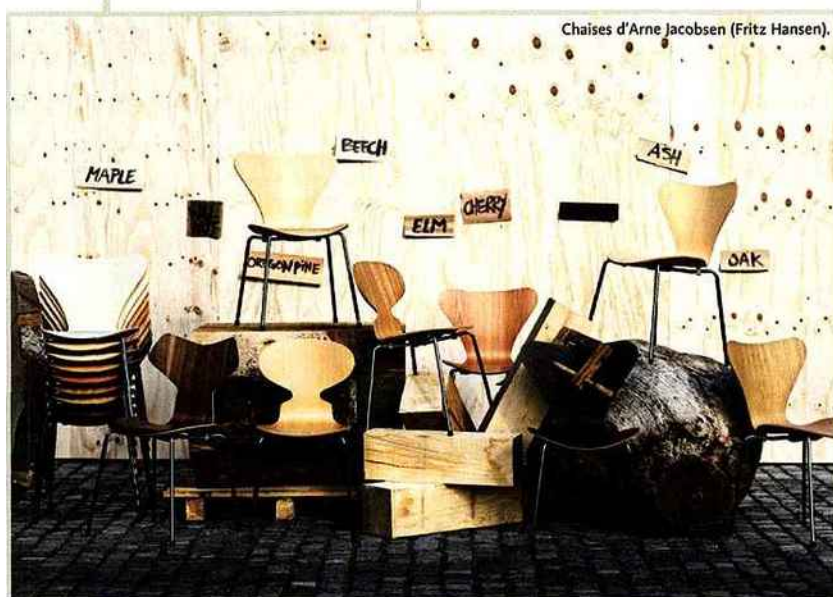
Chaises d'Arne Jacobsen (Fritz Hansen).