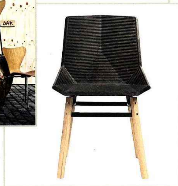
Chaise Green (m114).