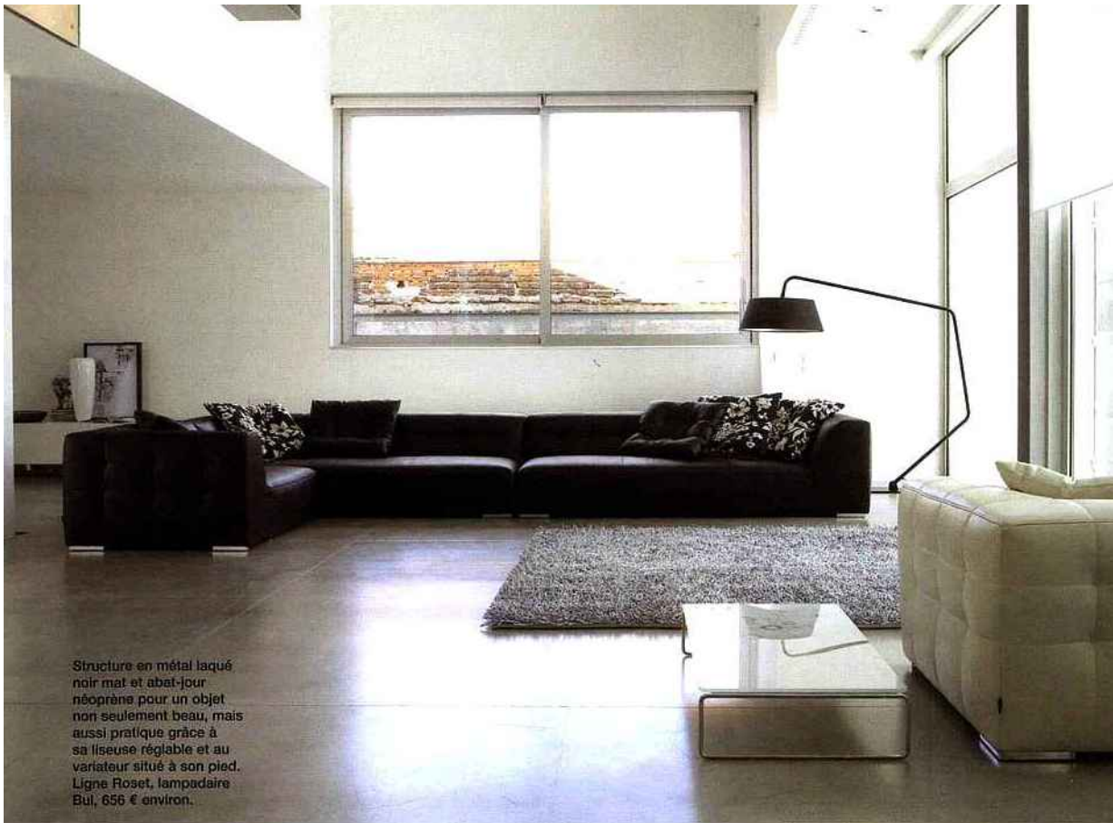
Structure en métal laqué noir mat et abat-jour néoprène pour un objet non seulement beau, mais aussi pratique grâce à sa liseuse réglable et au variateur situé à son pied. Ligne Roset, lampadaire Bul, 656 € environ.

► Ce lustre contemporain en verre et métal diffuse une pluie de lumière via ses élégantes petites lampes. Habitat, suspension Alys, 190 € environ.