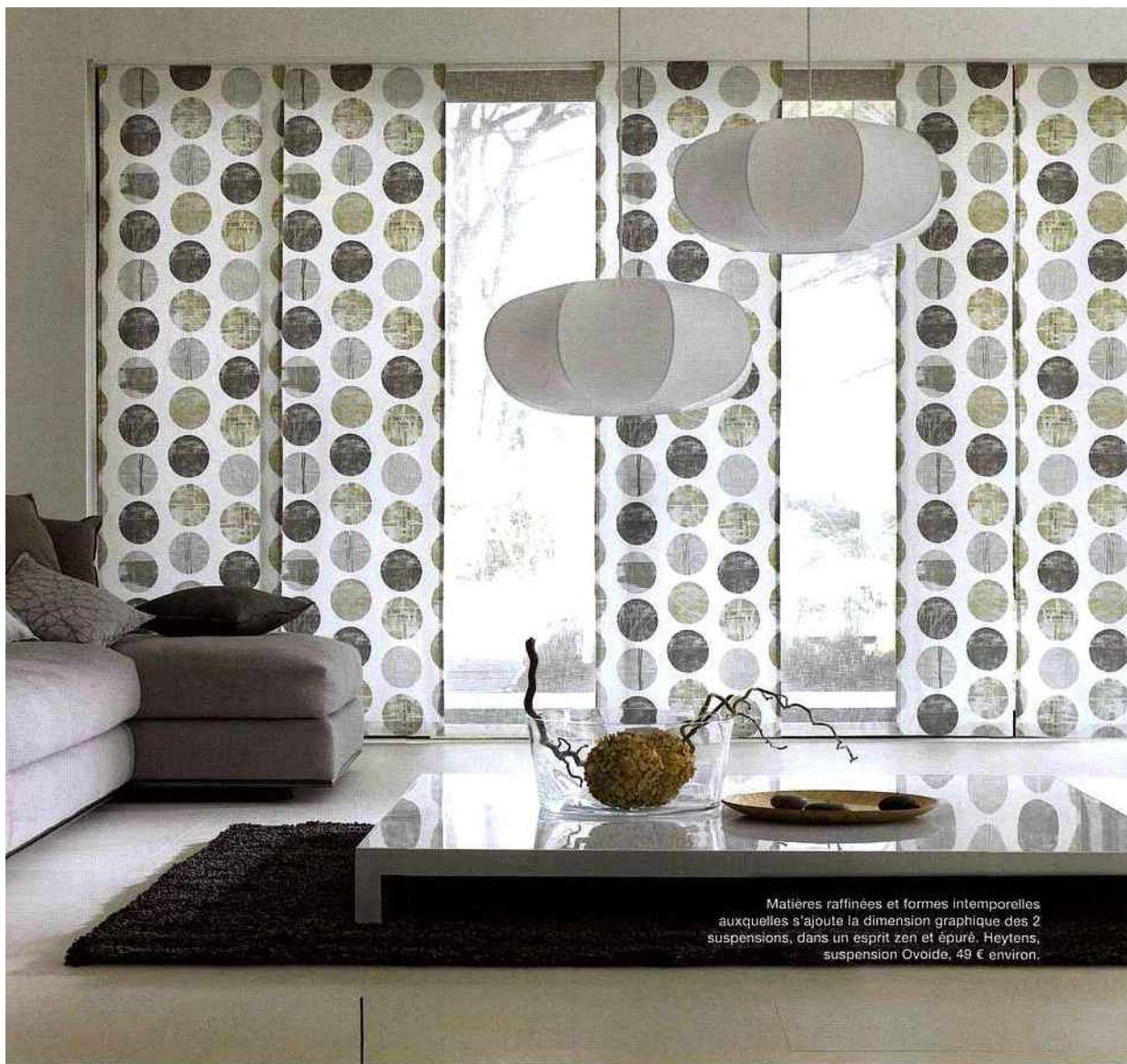
Matières raffinées et formes intemporelles auxquelles s'ajoute la dimension graphique des 2 suspensions, dans un esprit zen et épuré. Heytens, suspension Ovoïde, 49 € environ.

► Design rétro signé Noé Duchaufour-Lawrance pour cette suspension tout en délicatesse et en élégance. Forestier suspension East, 650 € environ.