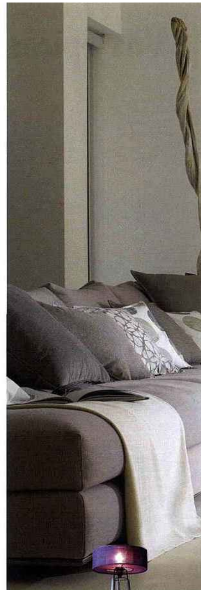
► Cette jolie création sur pied en bois vieilli est fabriquée avec un tissu 100% matière végétale, disponible en 7 coloris. Graine d'Intérieur, lampadaire Nonne, à partir de 289 €.

partout, le lampadaire est particulièrement adapté aux pièces à vivre qui demandent plusieurs sources