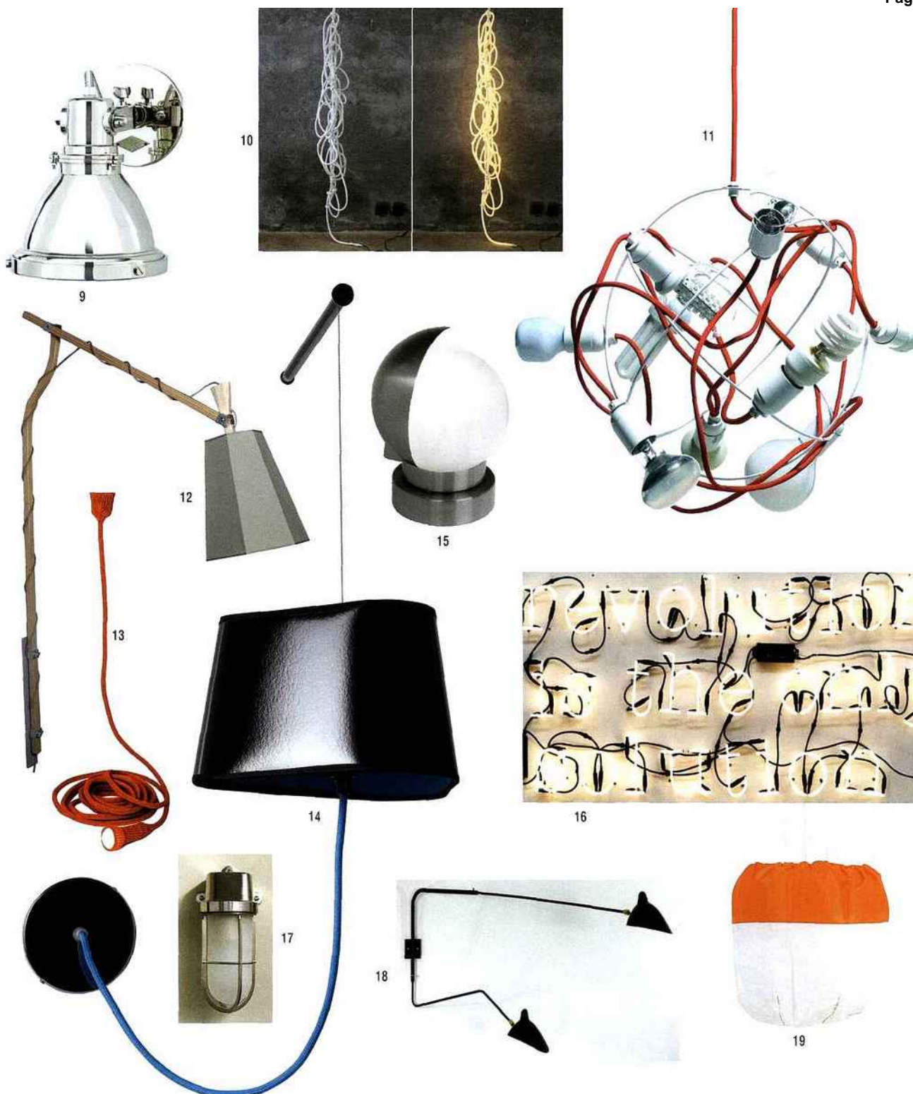
9. Applique « Fulton Small Sconce » en nickel poli, hauteur 21 cm, profondeur 17 cm, 532 €, Ralph Lauren Home. 10. Lampe « Ropes » de Christian Haas ; toutes les « Ropes » (cordes), uniques et numérotées, sont faites main : 6 m (995 €), 9 m (1 295 €) et 12 m (1 595 €), Gallery S. Bensimon. 11. Suspension « Wow », pour une multitude de points lumineux, 188 €, Mathieu Chailières. 12. Lampadaire mural « Luxiole », Kristian Gavaille, 1 349 €, Designheure. 13. « Matt », plafonnier en laine mérinos et angora, 12 m de long, 290 €, Llot Llov. 14. « Grand Nuage », une applique (enfin !) modulable, 199 €, Hervé Langlais, Designheure. 15. Une liseuse parfaite équipée d'un cache pivotant, 990 €, Perzel. 16. Lettres néon permettant tous les messages possibles, à partir de 39,90€ la lettre, Fleux. 17. Applique « Admiral », en bronze poli et verre sablé, environ 650 €, Tekna. 18. Applique à bras pivotants numérotée et signée, 3 349 €, designer Serge Mouille, Les Éclairagistes. 19. Suspension « Spi » de Arik Levy pour Forestier , 80 cm de diamètre, 650 €, Forestier.