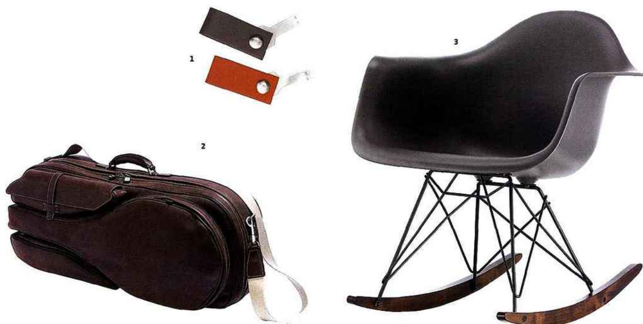
1/ Clé USB 8 Go, en veau, 190 €. Hermès. 2/ My Tennis Bag en cuir, 5 390 €. Loro Piana. 3/ Vitra lance une édition limitée du célèbre fauteuil à bascule RAR de Charles et Ray Eames (1948). Coque grise, piètement érable. 492 €.