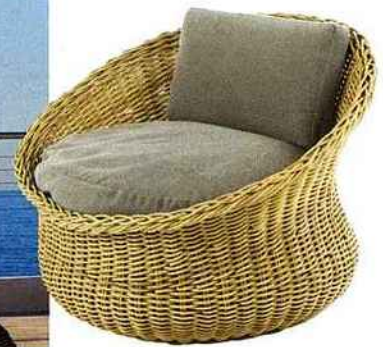
Fauteuil Mamy, en fibre synthétique tressée main, et coussin 100 % acrylique. Unopiu.