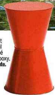
Tabouret en métal galvanisé laqué Epoxy. La Redoute.