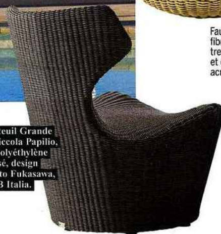
Fauteuil Grande et Piccola Papilio, en polyéthylène tressé, design Naoto Fukasawa, B&B Italia.