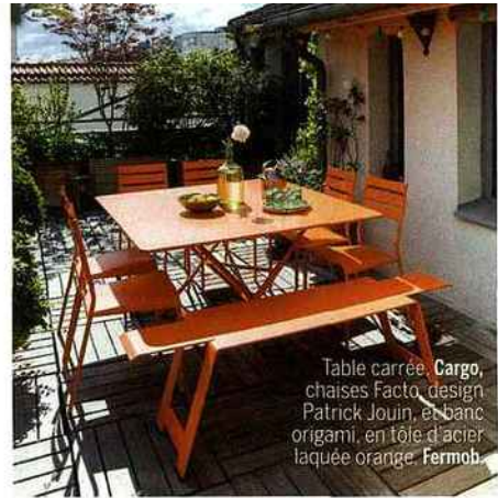
Table carrée Cargo, chaises Facto, design Patrick Jouin, et banc origami, en tôle d'acier laquée orange. Fermob.