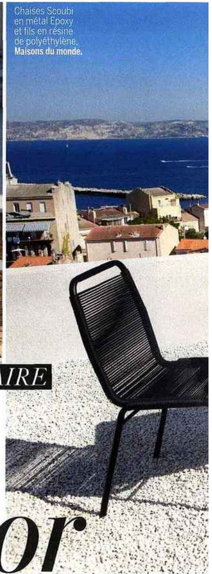
Chaises Scoubi en métal Epoxy et fils en résine de polyéthylène, Maisons du monde.