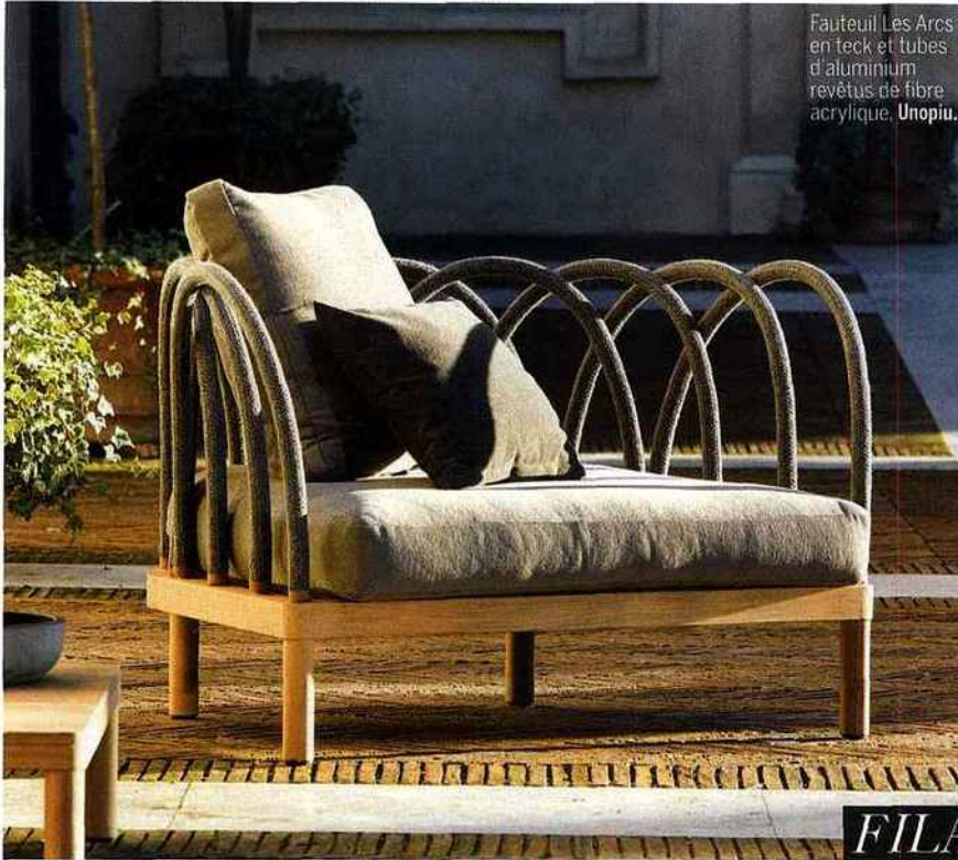
Fauteuil Les Arcs en teck et tubes d'aluminium revêtus de fibre acrylique, Unopiu.