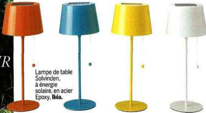
Lampe de table Solvinden, à énergie solaire, en acier Epoxy. Ikéa.