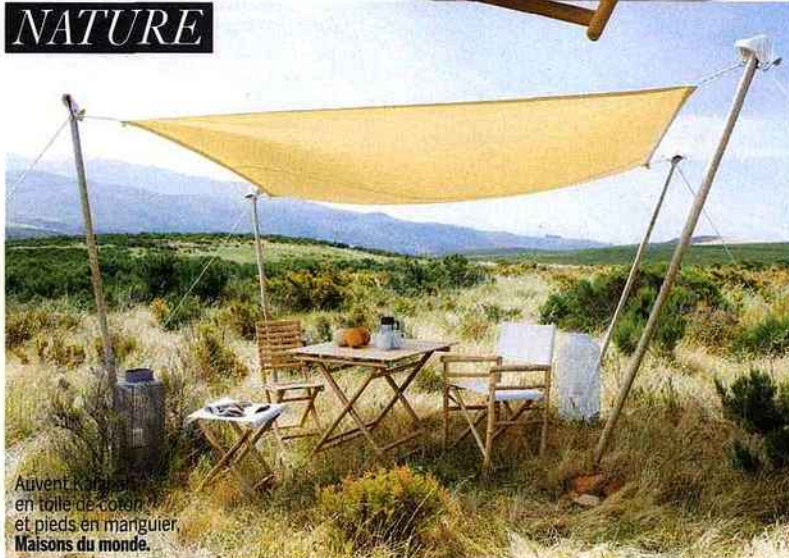
Auvent Kid en toile de coton, et pieds en manguier. Maisons du monde.