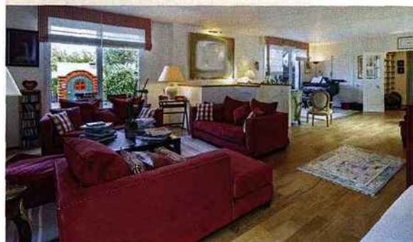
DUPLEX DE 210 M 2 AU 6 E ÉTAGE D'UN IMMEUBLE DE 2003, PASSAGE DOISY, À PARIS.

In Paris, the market for upscale properties (i.e., with an asking price of over €3m) is collapsing. It went down 70% in the first semester of 2013 vs. the same period last year). However, our roster of foreign clients, from Eastern Europe, the Middle East, Brazil and China notably, are still looking for estates in our country. In addition to our offices in the most sought-after cities, including Geneva, Moscow, and Courchevel, we have developed a new real estate programme that provides commercial and marketing assistance to developers. We now have more than 200 apartments on sale in cities such as Deauville, Le Chesnay, Puteaux, or Saint-Cloud. Also, as a former luxury-only brand, we plan to open new activities linked to the needs of our wealthy clients.