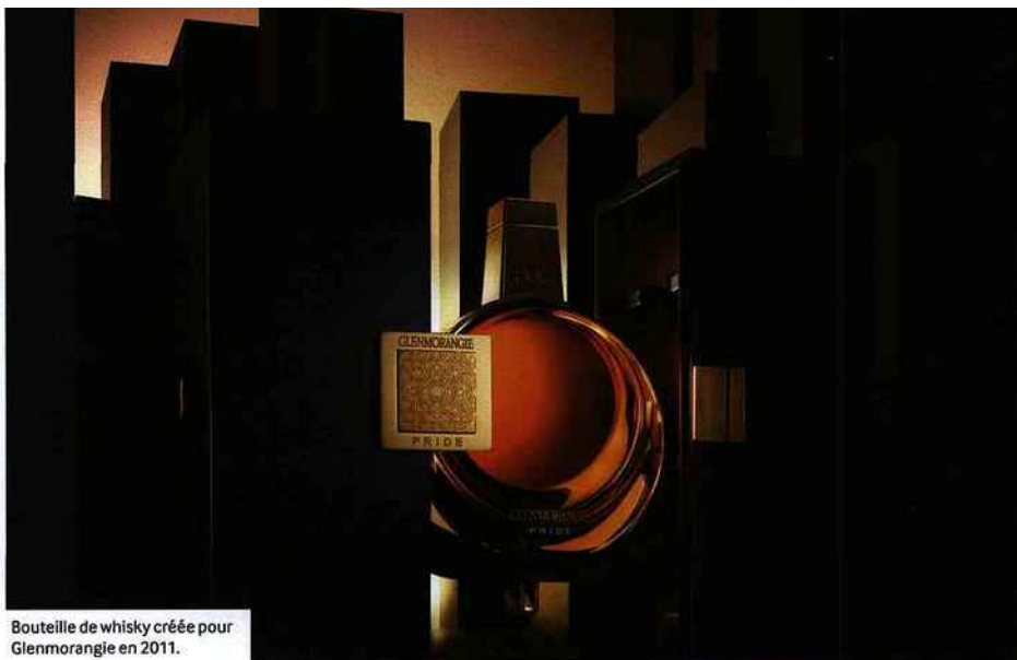
Bouteille de whisky créée pour Glenmorangie en 2011.