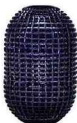
Boîte à bijoux Bijou caché dessinée pour la Cristallerie Saint-Louis en 2012.