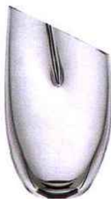
Carafe Senso soufflée bouche pour La Rochère en 2010.