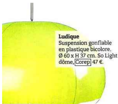
Ludique Suspension gonflable en plastique bicolore. Ø 60 x H 37 cm. So Light dôme, Corep 47 €.