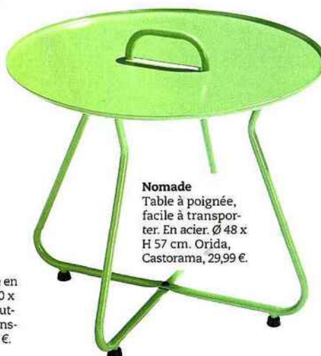
Nomade Table à poignée, facile à transporter. En acier. Ø 48 x H 57 cm. Orida, Castorama, 29,99 €.