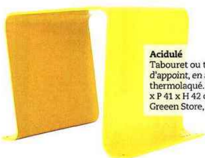
Acidulé Tabouret ou table d'appoint, en acier thermolaqué. L 54,5 x P 41 x H 42 cm. Green Store, 150 €.