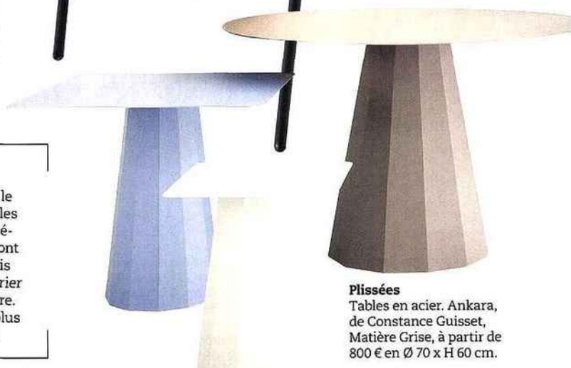
Plissées Tables en acier. Ankara, de Constance Guisset, Matière Grise, à partir de 800 € en Ø 70 x H 60 cm.

Après avoir plébiscité tour à tour, le fer forgé, le rotin, le teck, l'aluminium ou, dernièrement, les résines tressées, aujourd'hui, on préfère tout mélanger! Pour autant les matériaux intemporels ont toujours la côte, même s'ils demandent parfois plus d'entretien. Mais on n'hésite pas à les marier avec des produits contemporains, faciles à vivre. Un point commun : tous ont pris des allures plus design pour ressembler au mobilier intérieur.