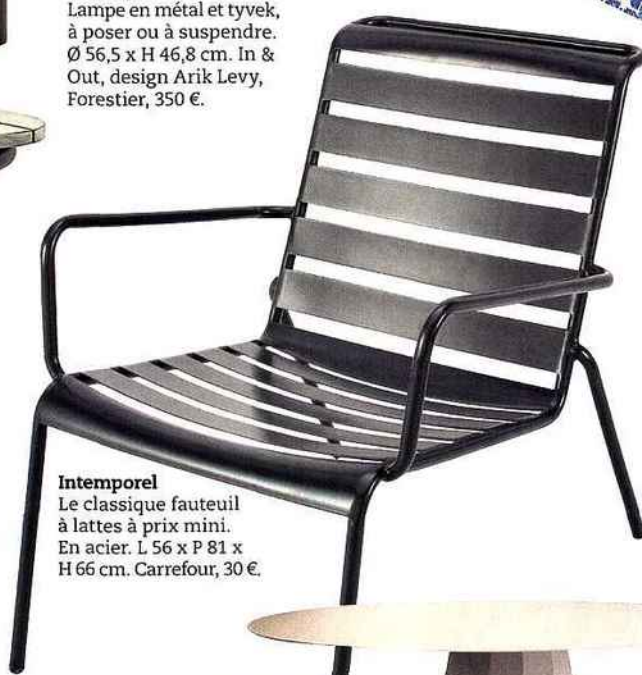
Intemporel Le classique fauteuil à lattes à prix mini. En acier. L 56 x P 81 x H 66 cm. Carrefour, 30 €.