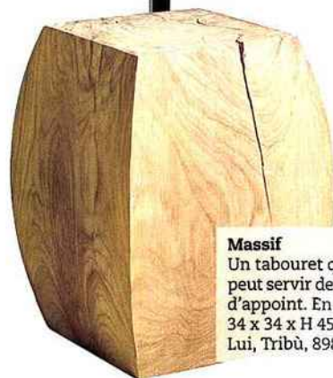
Massif Un tabouret qui peut servir de table d'appoint. En teck. 34 x 34 x H 45 cm. Lui, Tribù, 898 €.