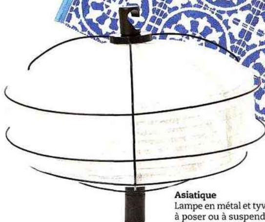
Asiatique Lampe en métal et tyvek, à poser ou à suspendre. Ø 56,5 x H 46,8 cm. In & Out, design Arik Levy, Forestier, 350 €.