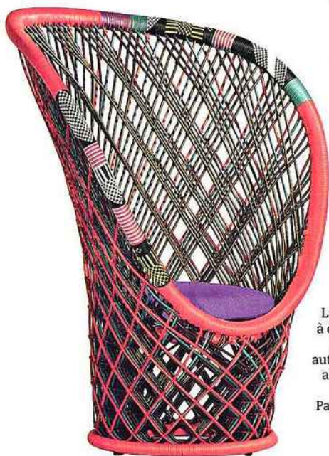
Ethnique Un fauteuil de rêve, en fibre synthétique tressée et alumi- nium, signé Patricia Urquiola. 110 x 89 x H 130 cm. Pavo Real, Driade, 1630 €.