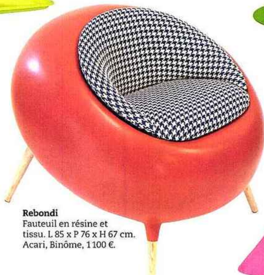
Rebondi Fauteuil en résine et tissu. L 85 x P 76 x H 67 cm. Acari, Binôme, 1100 €.