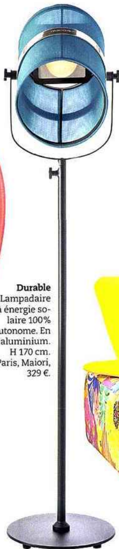
Durable Lampadaire à énergie so- laire 100% autonome. En aluminium. H 170 cm. Paris, Maiori, 329 €.