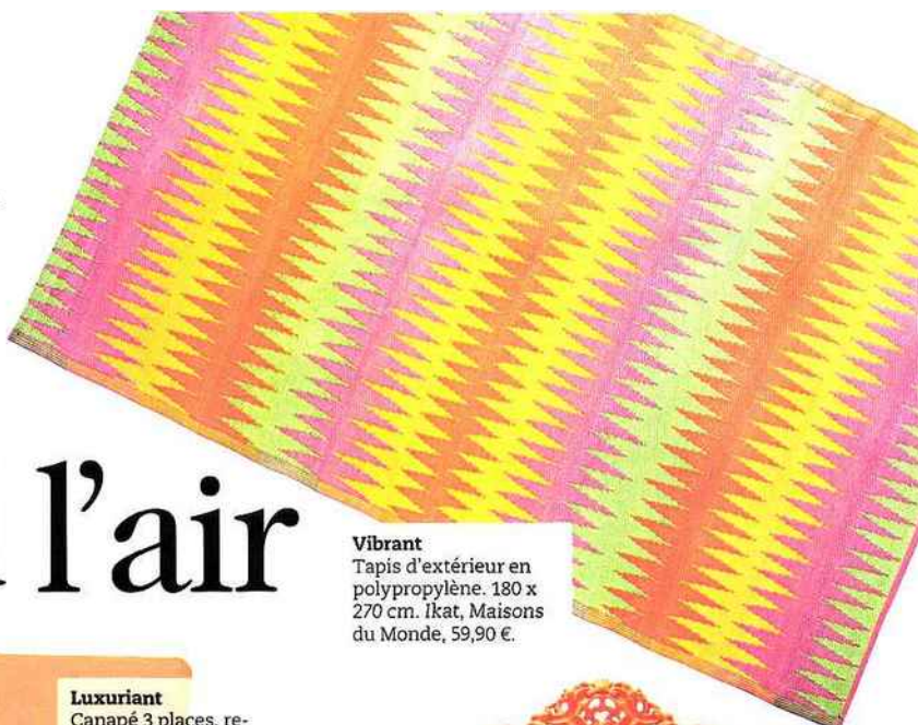
Vibrant Tapis d'extérieur en polypropylène. 180 x 270 cm. Ikat, Maisons du Monde, 59,90 €.