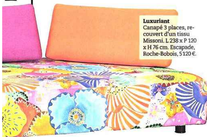
Luxuriant Canapé 3 places, re- couvert d'un tissu Missoni. L 238 x P 120 x H 76 cm. Escapade, Roche-Bobois, 5 120 €.