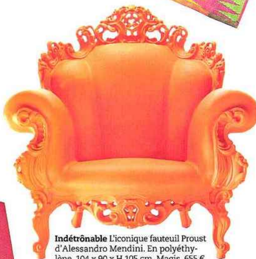
Indétrônable L'iconique fauteuil Proust d'Alessandro Mendini. En polyéthylène. 104 x 90 x H 105 cm. Magis, 655 €.