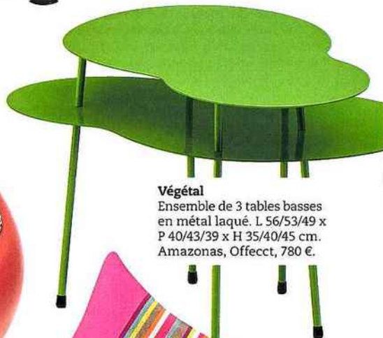
Végétal Ensemble de 3 tables basses en métal laqué. L 56/53/49 x P 40/43/39 x H 35/40/45 cm. Amazonas, Offecct, 780 €.