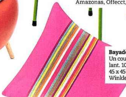
Bayadère Un coussin pétill- lant. 100% coton. 45 x 45 cm. Bahia, Winkler, 24,90 €.