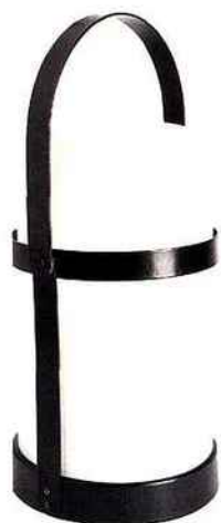
Pratique Une lanterne d'extérieur nomade. En métal laqué et verre dépoli. H 27 cm. Farm, Habitat, 59 €.