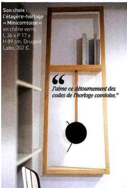
Son choix : l'étagère-horloge « Minicomtoise » en chêne verni, L 36 x P 17 x H 89 cm, Drugeot Labo, 302 €.

Cette jeune et talentueuse designer a la tête dans les étoiles, mais les pieds ancrés au sol. Ça tombe bien. Elle est en visite au Printemps, boulevard Haussmann à Paris, à l'espace meubles du grand magasin, situé entre ciel et terre.