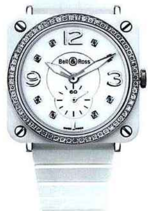
À gauche Robe Tiare, cintrée et scintillante, 240 €. Ba&sh. Au milieu en haut Portefeuille Vivienne en cuir, 1 420 €. Louis Vuitton. Au milieu en bas Babies en cuir et métal, 225 €. Zapa. À droite Montre BRS White Ceramic Phantom & Diamonds, 6 500 €. Bell&Ross.