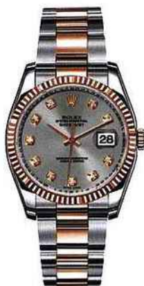
À gauche en haut Manchette en perles tissées, 130 €. Laurence Abela. À gauche en bas Petit sac en cuir matelassé, 380 €. Zadig & Voltaire. Au milieu Montre Oyster Perpetual Datejust en or Everose, cadran serti de dix diamants, 10 300 €. Rolex. À droite Lampe Mini Pipistrello, design Gae Aulenti (1966), à partir de 598 €. Martinelli Luce sur Lightonline.