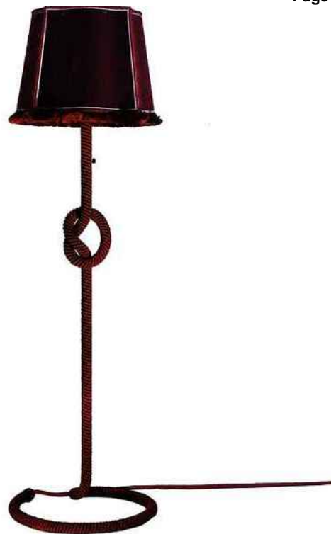
À gauche Le canapé Adelphi existe en trois tailles, à partir de 2 725 €. Designers Guild. À droite Lampadaire de la designer Paola Navone, 2 250 €. Baxter chez Merci.