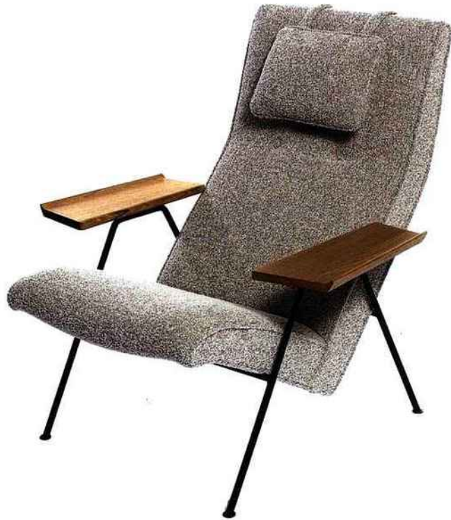
À gauche Eau de Parfum Opium Collector 50 ml, 95 €. Yves Saint Laurent. À droite Fauteuil Reclining chair du designer britannique Robin Day (1952), à partir de 2 000 €. Twentytwentyone.