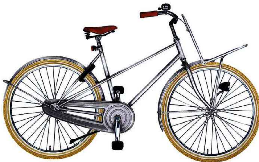
À gauche My Burberry, Eau de Parfum, 50 ml, 82 €. Burberry. À droite Tulipbikes, la société de vélos 100 % hollandaise, répond à un concept très précis : permettre à chacun de créer en ligne son vélo personnalisé. Livré dans un délai de deux semaines, ce modèle couleur argent est disponible à partir de 599 €. Tulipbikes.