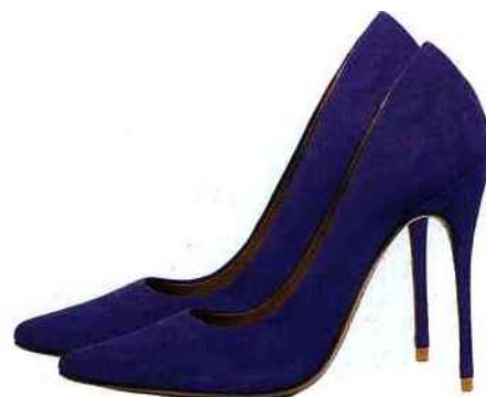
À gauche Vases Bubble en verre soufflé, design Arik Levy, à partir de 1380 € pièce. La Galerie Imaginaire du Bon Marché Rive Gauche. À droite Escarpins Aelia en nubuck, 140 €. Cosmoparis.