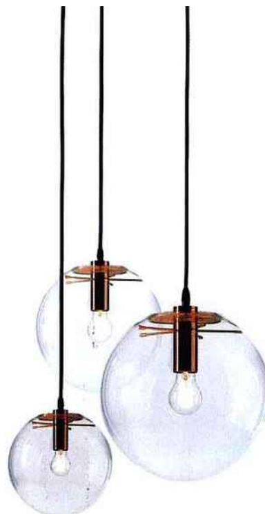
À gauche Perfecto à sequins, 285 €. Dress Gallery aux Galeries Lafayette. À droite Suspensions Selene en verre soufflé, structure en cuivre, design Sandra Lindner, à partir de 475 € pièce. ClassiCon chez FR66.