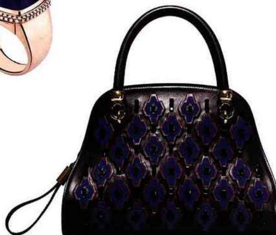
À gauche Blouson en cuir matelassé, 455 €. IKKS. Au milieu Bague Pain de Sucre interchangeable en or rose, diamants blancs, cabochon en améthyste et or rose, 6 190 €. Fred. À droite Sac Sellas Couture en cuir brodé, 6 200 €. Tod's.