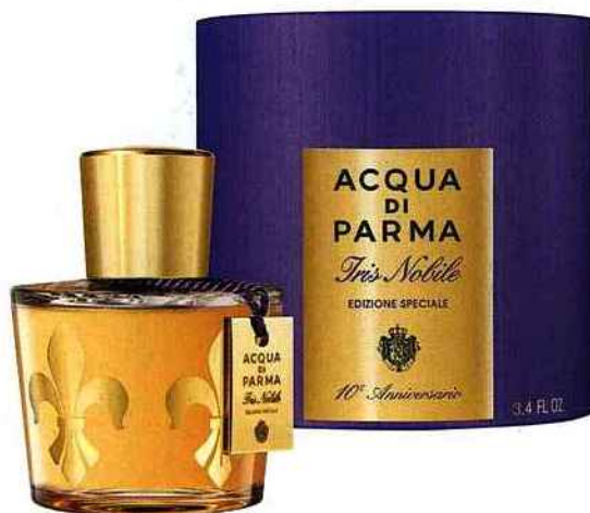
À gauche en haut Montre La Mini D de Dior, boîtier en or rose, lunette et couronne serties de diamants, édition limitée, 12 000 €. Dior Horlogerie. À gauche en bas Sac à bandoulière en cuir saffiano, 1300 €. Prada. À droite Acqua di Parma, Iris Nobile, édition spéciale 10 e anniversaire, 100 ml, 139 €.