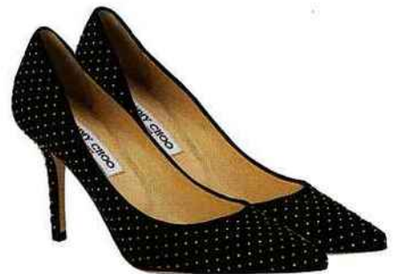
À gauche Fauteuil Polygon, design Sven Jonke, Christoph Katzler et Nicola Radeljkovic, 780 €. Prostorja. www.thegoodconceptstore.com . À droite Escarpins Agnès en veau velours noir et petits clous argentés, 675 €. Jimmy Choo.