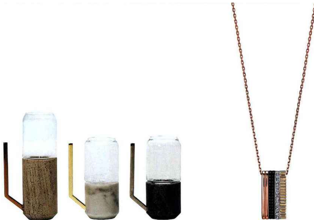
À gauche Bougeoir Halo en marbre gris, noir, marron ou blanc. Design Arik Levy, petit modèle (195 €), grand modèle (250 €). Forestier À droite Pendentif Quatre Classique, pavé de diamants sur or jaune, or blanc et or rose et PVD marron, 4980 €. Boucheron.