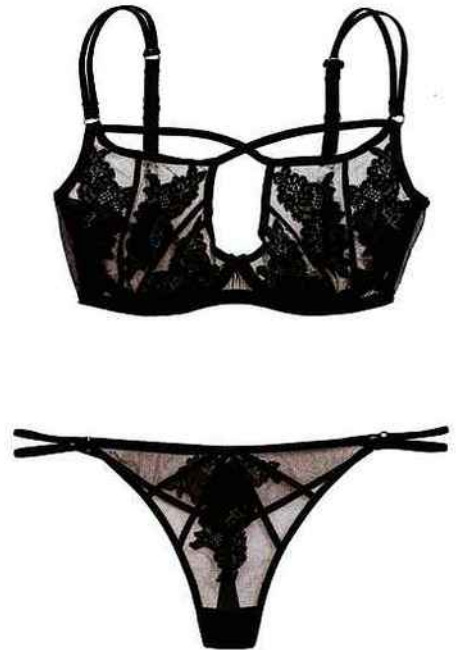
À gauche Si Intense, eau de parfum, 50 ml, 92,50 €. Giorgio Armani chez Sephora. Au milieu Sac Classique en velours, 2 450 €. Chanel. À droite Parure en tulle et dentelle, soutien-gorge (200 €), string (140 €) et porte-jarretelles (265 €). Agent Provocateur aux Galeries Lafayette.