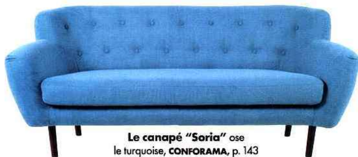
Le canapé "Soria" ose le turquoise, CONFORAMA , p. 143

Dans le reportage "Ils sont beaux, nos lavabos" (n° 232, p. 216), le lavabo présenté fait partie de la collection "Bowl" en Céramilux, Ø 55 cm, 1 029 €. Colonne "Free standing" en cuivre glossy, Ø 55 x h. 85 cm, 1 749 €. Miroir mural bordé de cuivre glossy, l. 50 x h. 70 cm, 879 € et psyché, 48 x 45 x h. 170 cm, 1 314 €. Le tout a été dessiné par Arik Levy pour INBANI (Sopha Industrie). Robinetterie "White", 267 €, Sopha Industrie. Tabouret "Flip Around", MENU .