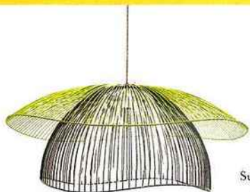
Ailes LIBRES Suspension Papillon, d'Élise Fouin, en fil métallique laqué. 795 €. Forestier.