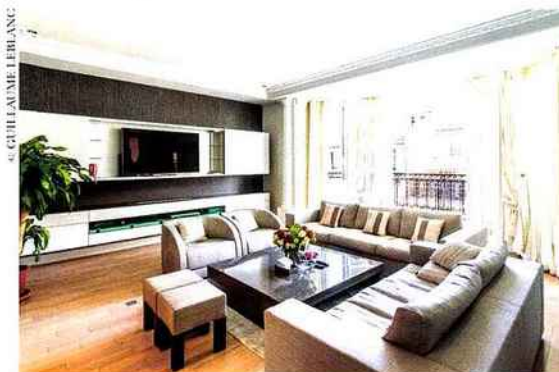
PROCHE DES JARDINS DU TROCADERO, UN APPARTEMENT FAMILIAL DE 230 M 2 .