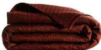
ALEXANDRE TURPAULT Couvre-lit Palace. Matelassé motifs écailles en satin de coton. Dans la même collection : coussin et chemin de lit À partir de 399€