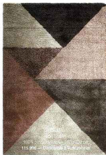
ESSENCE 100% polyacrylique. 50 x 70 cm 119,95€ — Disponible à Vendenheim