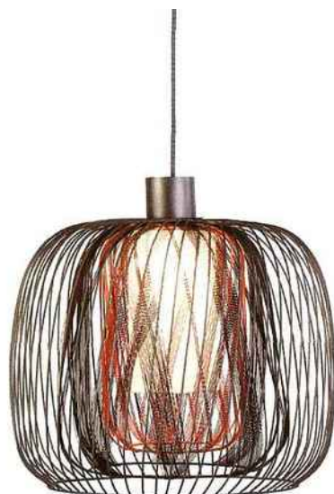
FORESTIER Suspension Bodyless. Design : Arik Levy Ø 48 x H 37,5 cm — Métal et textile 370€