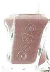
ESSIE Vernis Gel couture Take me to Thread #70 14,95€