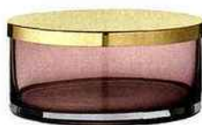
AYTM Boîte Tota Large. Cylindre Ø 15,5 x H 7 cm Laiton et verre 58,80€