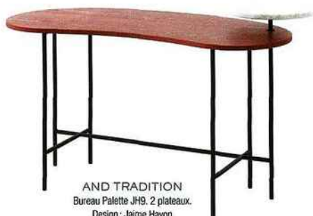
AND TRADITION Bureau Palette JH9. 2 plateaux. Design : Jaime Hayon Acier laqué, frêne et marbre — L 140 x P 62 x H 83 cm 1999€