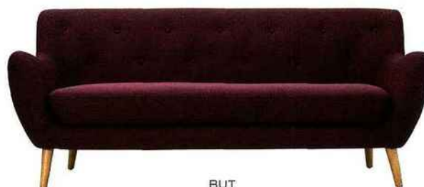
BUT Canapé Milo, 2 ou 3 places. Bois d'eucalyptus et contreplaqué. Ressorts zigzag et sangles élastiques. Mousse polyuréthane de densité 24 kg/m³. Tissu 100% polyester À partir de 429€ — Disponible à Vendenheim