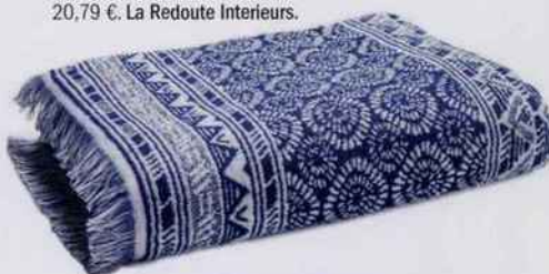
Drap de bain en éponge jacquard 100 % coton, finition frangée. L. 140 x l. 70 cm. 20,79 €. La Redoute Interieurs .