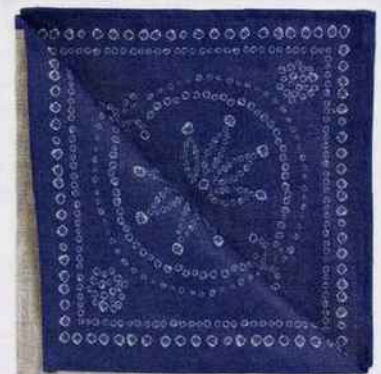
Serviettes de table en lin imprimé. 22,99 € le lot de 4. Zara Home.