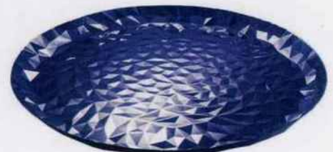
Les reflets irisés bleus du métal donnent un caractère précieux à ce plateau. En acier coloré à la résine époxy. Ø 40 cm. 103 €. Alessi.