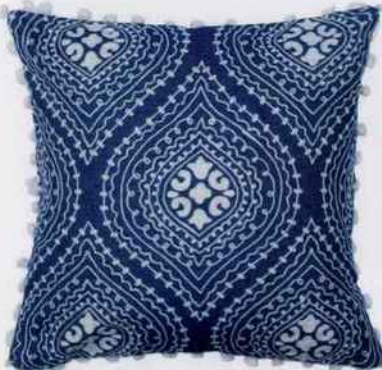
Cette housse de coussin ornée de broderie chaînette en fil de laine apporte une touche subtilement exotique. L. 40 x l. 40 cm. 39,20 €. Madura.