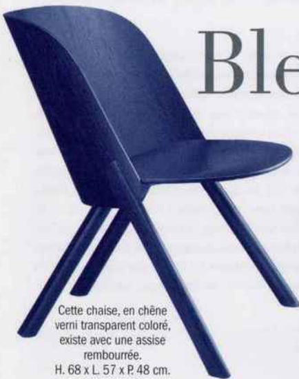
Cette chaise, en chêne verni transparent coloré, existe avec une assise rembourrée. H. 68 x L. 57 x P. 48 cm. 372 €. FR 66.