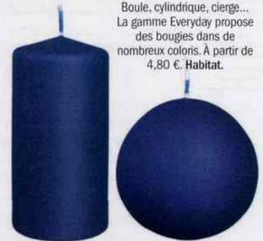
Boule, cylindrique, cierge... La gamme Everyday propose des bougies dans de nombreux coloris. À partir de 4,80 €. Habitat.