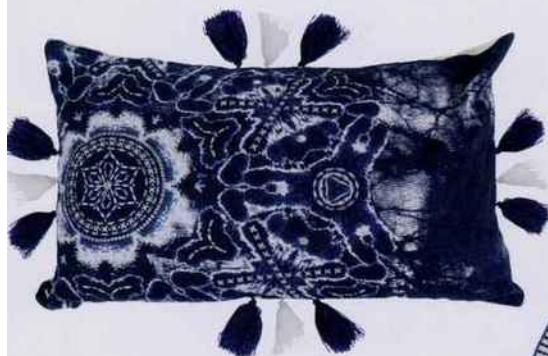
Un festival de pompons et de palmettes étourdissantes sur cette housse de coussin. L. 40 x l. 40 cm. 55,20 €. Madura .