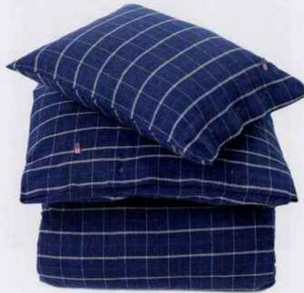
Cette parure à motif check est en 100 % coton flanelle. Housse de couette L. 240 x l. 220 cm et 2 taies L. 65 x l. 65 cm, 319 €. Lexington.