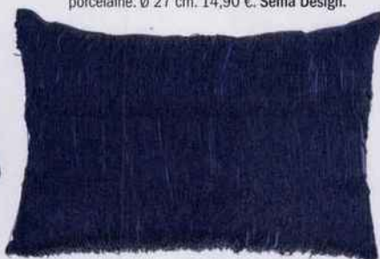
Look glamour et raffiné pour ce coussin paré de précieuses franges. L. 60 x l. 40 cm. 47 €. Bloomingville . Made in Design .