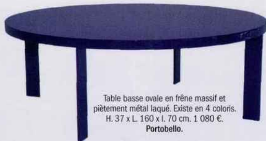
Table basse ovale en frêne massif et piètement métal laqué. Existe en 4 coloris. H. 37 x L. 160 x l. 70 cm. 1 080 €. Portobello .