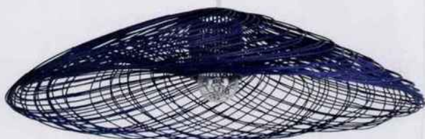
Cette suspension imaginée par Élise Fouin offre un design poétique. Ø 110 cm. 450 €. Forestier . Light on Line .