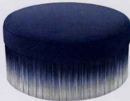
Vêtu de velours et de franges teintées en dégradé, ce pouf apporte une touche rétro de style années 30'. H. 40 x Ø 80 cm. 1 765 €. Moooi . Made in Design .