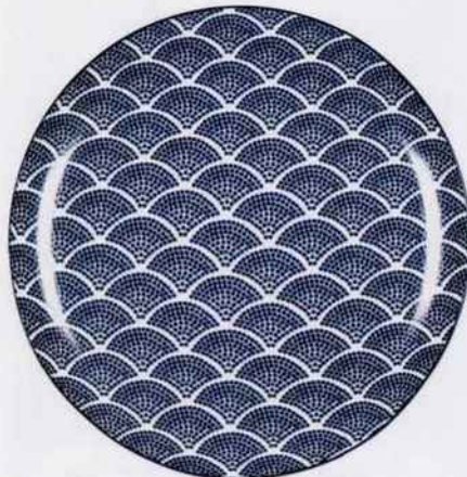
Assiette plate en porcelaine au motifs écailles d'esprit Art déco. Ø 26,5 cm. 34,90 € le lot de 6. Kaligrafik. Delamaison.