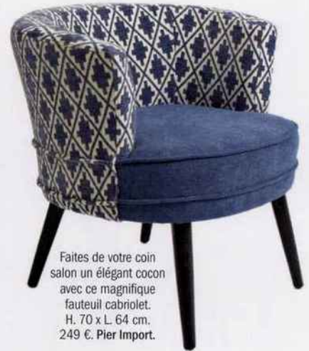
Faites de votre coin salon un élégant cocon avec ce magnifique fauteuil cabriolet. H. 70 x L. 64 cm. 249 €. Pier Import.