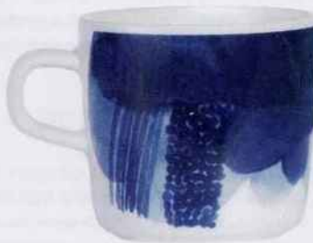
Cette tasse à café en porcelaine associe différentes teintes de bleu nuit pour un effet orageux. 18,50 €. Marimekko. Blou Paris.