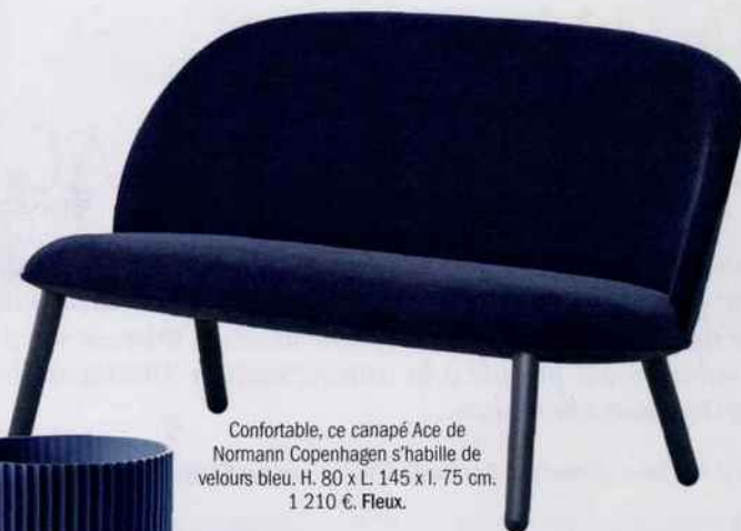
Confortable, ce canapé Ace de Normann Copenhagen s'habille de velours bleu. H. 80 x L. 145 x l. 75 cm. 1 210 €. Flex .