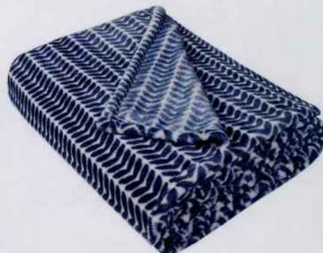
Ce superbe plaid arbore un imprimé végétal qui lui donne une touche très raffinée. L. 170 x l. 130 cm. 12,99 €. Alinéa .