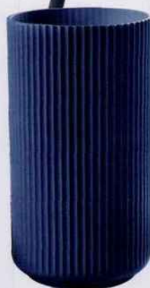
Ce vase en porcelaine de chez Lyngby Porcelain est d'une élégante simplicité avec ses motifs striés. H. 20 x Ø 10,5 cm. 96 €. Royal Design .